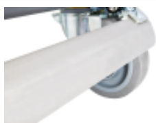
optie- isolatiecontainer- ergonomische- centrale-rem